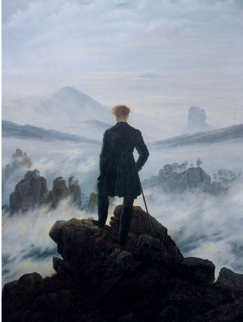
Wanderer über dem Nebelmeer – Caspar David Friedrich (1774–1840)