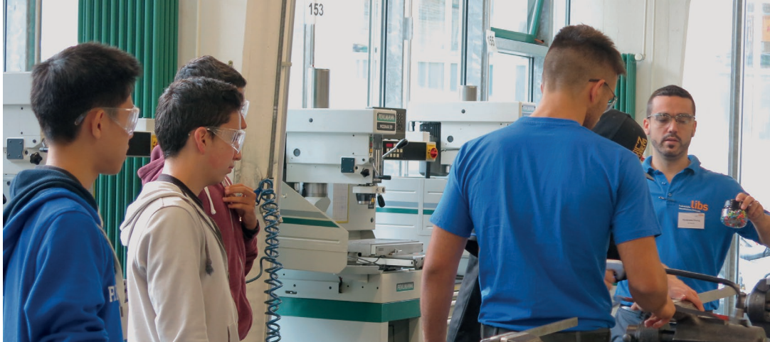
Tag der offenen Tür bei libs.

Früher war der Fokus etwas anders. Für denjenigen, der ein mechanisches Produkt erstellt hat, war der wirtschaftliche Hintergrund unwichtig bzw. nicht bekannt.